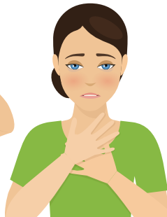
DIFICULTAD PARA RESPIRAR